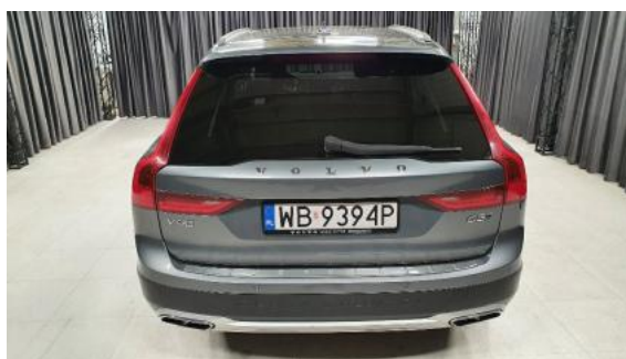
Fot. 4 Tył