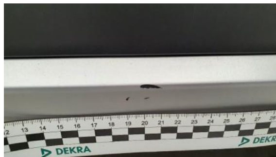
Fot. 42 Zderzak tylny (Rysa/Odprysk)