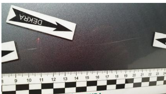
Fot. 35 Drzwi tylne prawe (Rysa/Odprysk)