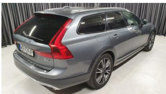
Fot. 3 Prawy bok tył