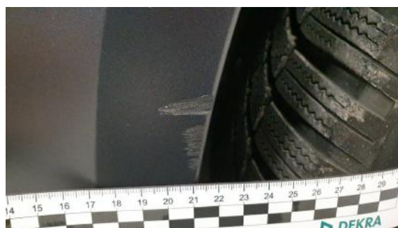
Fot. 28 Błotnik przedni prawy (Rysa/Odprysk)