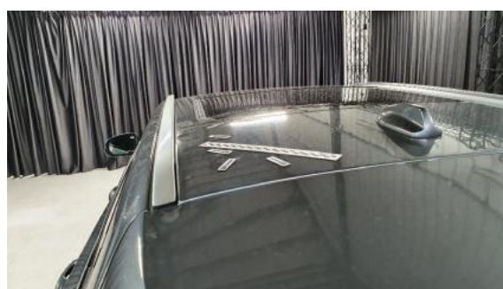
Fot. 44 Dach (Zdjęcie poglądowe 1)