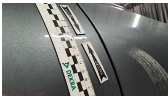
Fot. 32 Drzwi przednie prawe (Wgniecie./Odształ.)