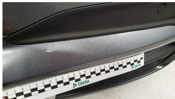
Fot. 26 Zderzak (Rysa/Odprysk 1)