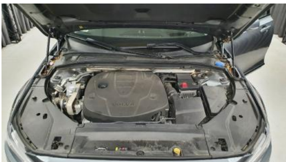
Fot. 17 Komora silnika