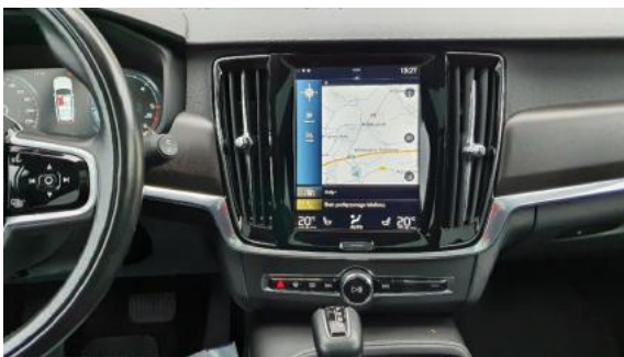
Fot. 13 Konsola środkowa