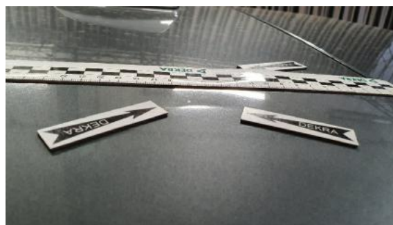
Fot. 46 Dach (Wgniecie./Odształ. 1)