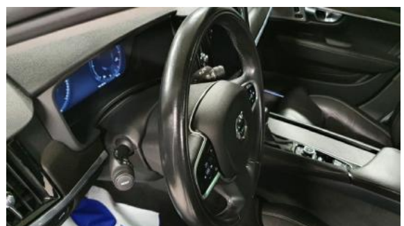
Fot. 16 Kierownica widok z lewej strony (widoczne przełączniki)