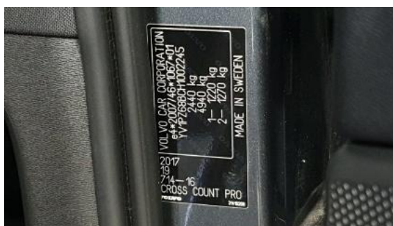
Fot. 8 Tabliczka