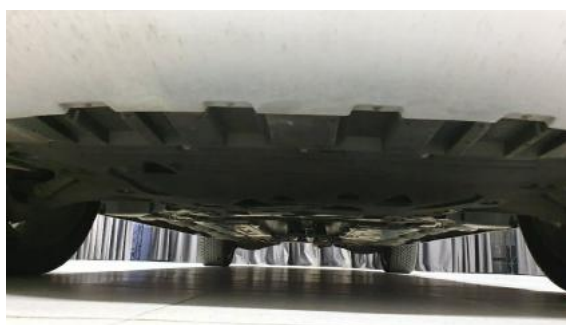
Fot. 20 Spód pojazdu przód