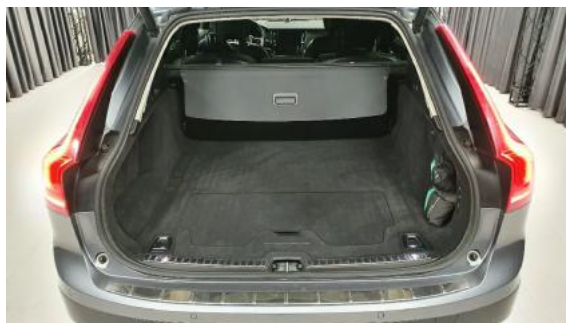
Fot. 18 Bagażnik