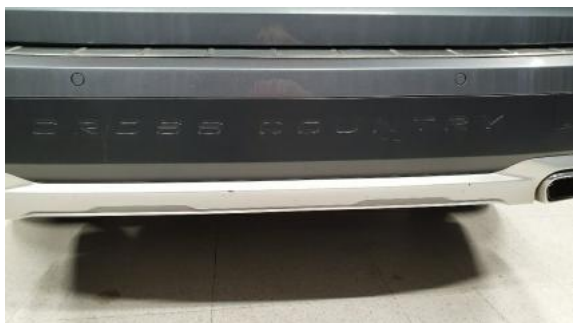
Fot. 41 Zderzak tylny (Zdjęcie poglądowe 1)