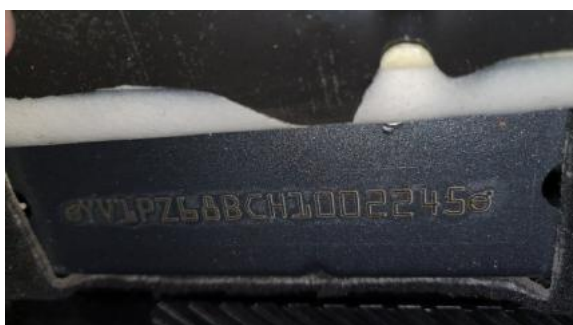
Fot. 7 Pole numerowe