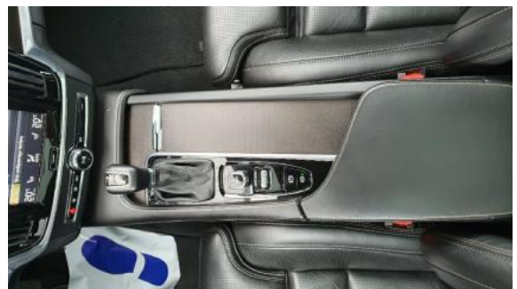
Fot. 14 Tunel środkowy