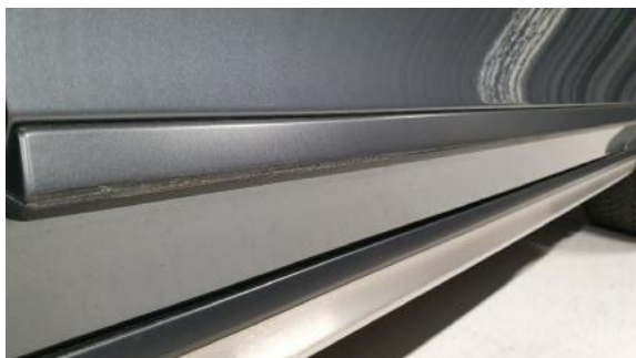
Fot. 33 Listwa drzwi przednich prawych (Rysa/Odprysk)