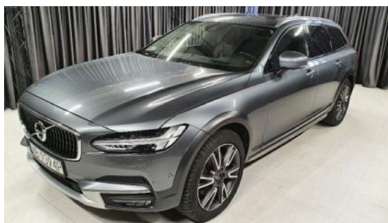
Fot. 6 Lewy bok przód