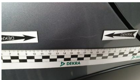
Fot. 38 Błotnik tylny prawy/ściana boczna prawa (Rysa/Odprysk)