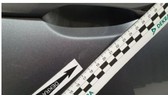
Fot. 31 Drzwi przednie prawe (Rysa/Odprysk)