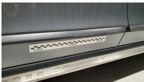
Fot. 36 Listwa drzwi tylnych prawych (Rysa/Odprysk)