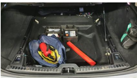
Fot. 19 Koło zapasowe/trójkąt/gaśnica