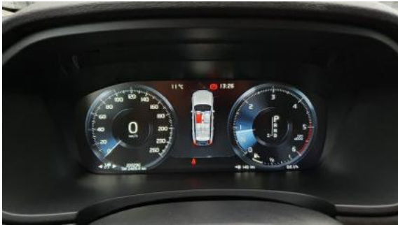
Fot. 9 Wskaźniki /przebieg/paliwo