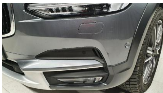
Fot. 24 Zderzak (Zdjęcie poglądowe 1)