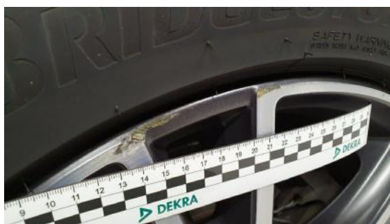
Fot. 40 Felga tylna prawa (Rysa/Odprysk)