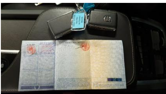
Fot. 23 Dowód rejestracyjny 2. strona / klucze