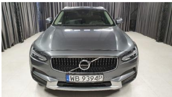
Fot. 1 Przód