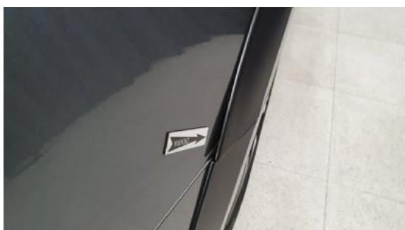
Fot. 39 Błotnik tylny prawy/ściana boczna prawa (Inne)