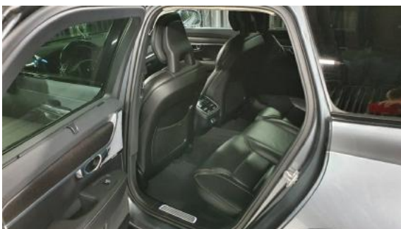
Fot. 11 Widok przez lewe tylne drzwi