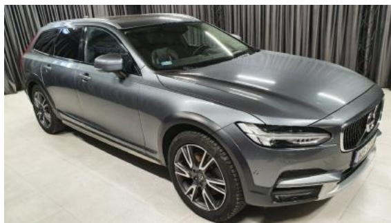
Fot. 2 Prawy bok przód