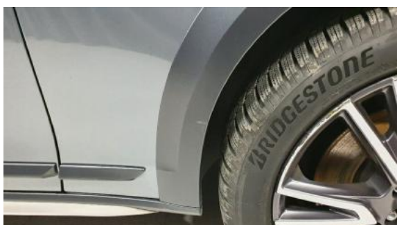
Fot. 27 Błotnik przedni prawy (Zdjęcie poglądowe 1)