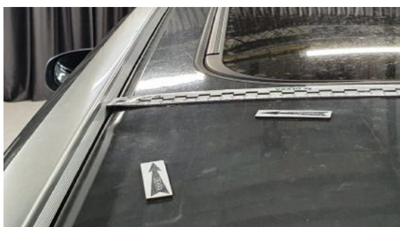
Fot. 47 Dach (Wgniecie./Odształ. 2)