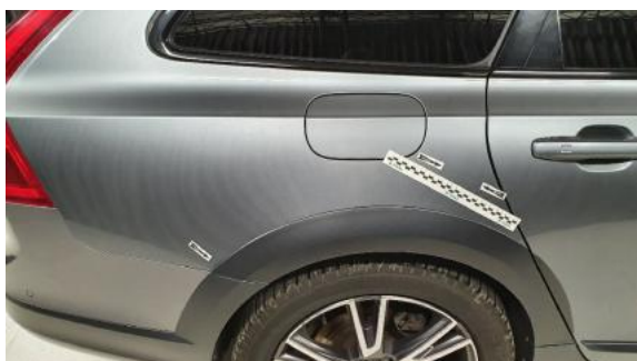
Fot. 37 Błotnik tylny prawy/ściana boczna prawa (Zdjęcie poglądowe 1)