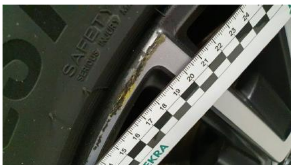
Fot. 29 Felga przednia prawa (Rysa/Odprysk)