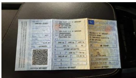
Fot. 22 Dowód rejestracyjny 1. strona