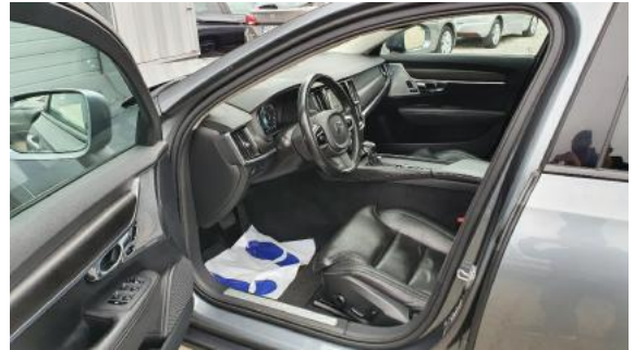
Fot. 10 Widok przez lewe przednie drzwi