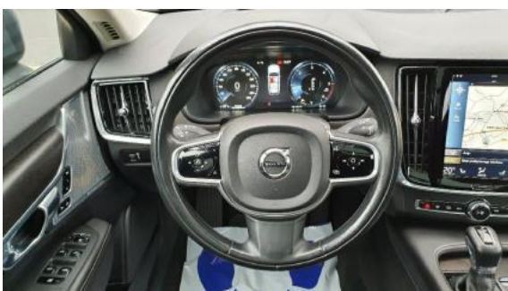
Fot. 15 Koło kierownicy