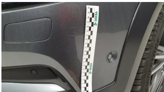
Fot. 25 Zderzak (Rysa/Odprysk)