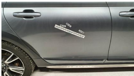
Fot. 34 Drzwi tylne prawe (Zdjęcie poglądowe 1)