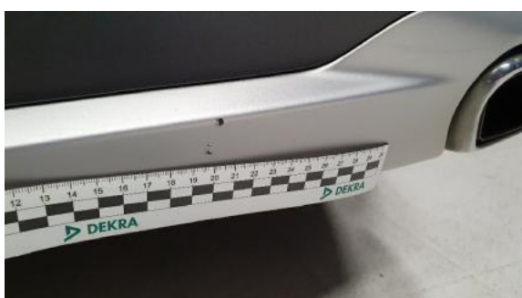
Fot. 43 Zderzak tylny (Rysa/Odprysk 1)