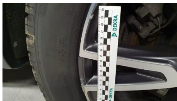
Fot. 48 Felga tylna lewa (Rysa/Odprysk)