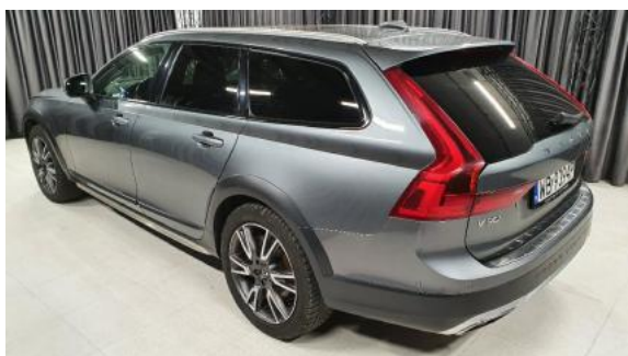
Fot. 5 Lewy bok tył