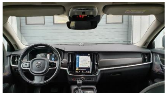
Fot. 12 Widok z tylnego siedzenia