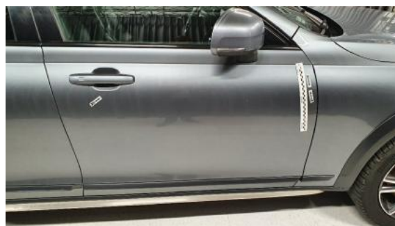
Fot. 30 Drzwi przednie prawe (Zdjęcie poglądowe 1)