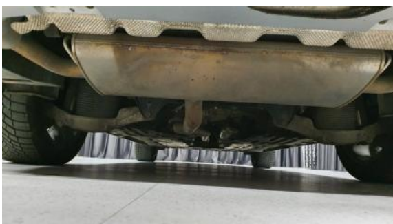
Fot. 21 Spód pojazdu tył