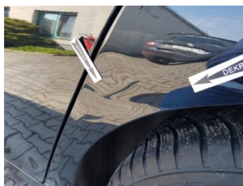
Fot. 40 Błotnik tylny lewy/ściana boczna lewa (Wgniecie./Odształ.)