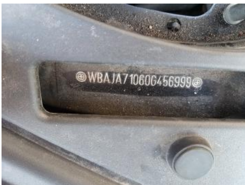
Fot. 7 Pole numerowe