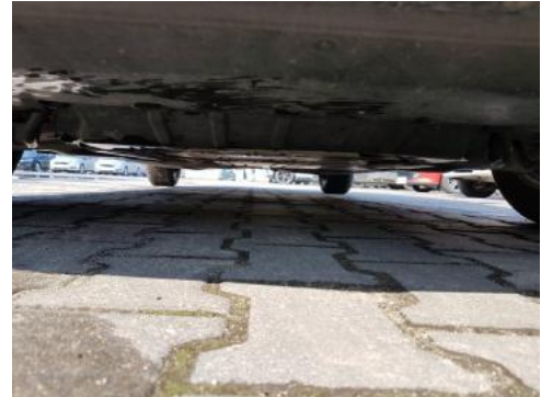
Fot. 18 Spód pojazdu przód