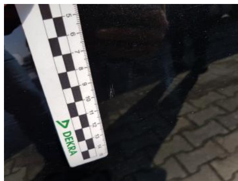
Fot. 34 Drzwi tylne prawe (Rysa/Odprysk 1)