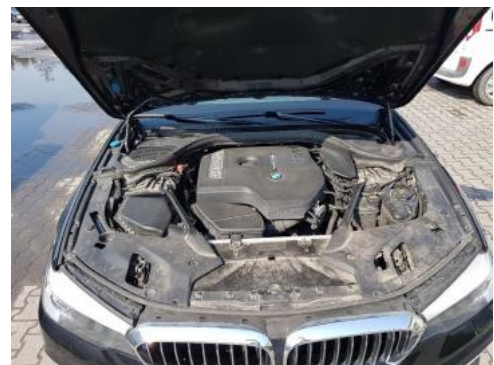
Fot. 16 Komora silnika