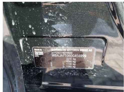
Fot. 8 Tabliczka