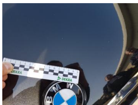
Fot. 28 Pokrywa komory silnika (Rysa/Odprysk)