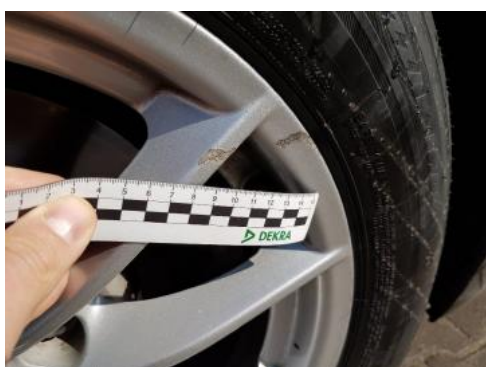
Fot. 35 Felga tylna prawa (Rysa/Odprysk)