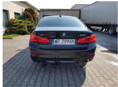
Fot. 4 Tył