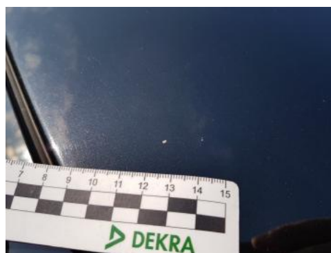
Fot. 38 Dach (Rysa/Odprysk)