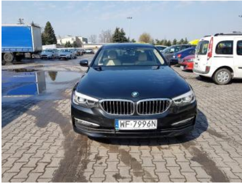
Fot. 1 Przód