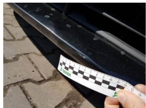
Fot. 24 Zderzak (Wgniecie./Odształ.)