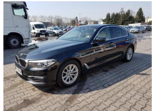
Fot. 6 Lewy bok przód