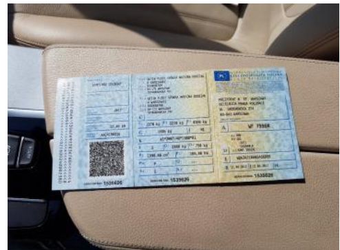
Fot. 20 Dowód rejestracyjny 1. strona