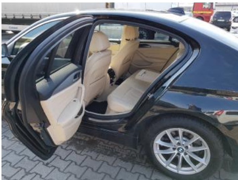
Fot. 11 Widok przez lewe tylne drzwi