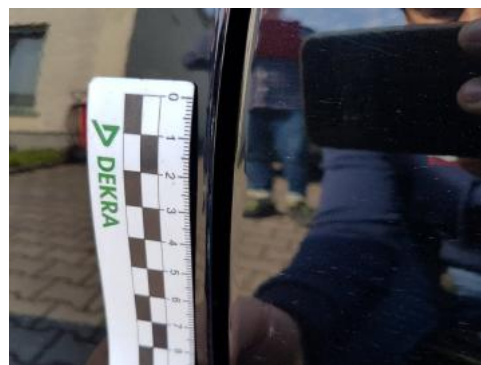
Fot. 42 Drzwi przednie lewe (Rysa/Odprysk)