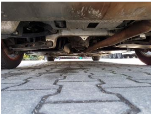
Fot. 19 Spód pojazdu tył