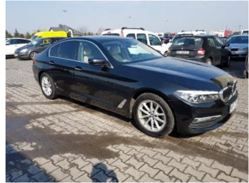
Fot. 2 Prawy bok przód