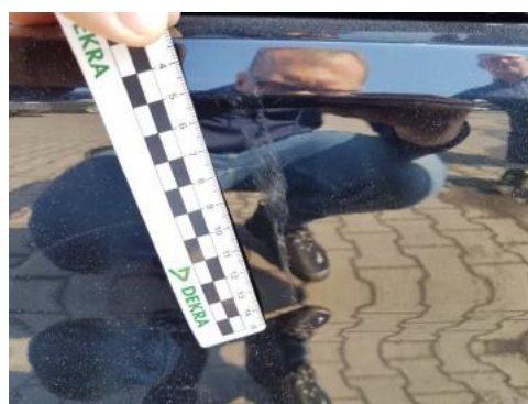
Fot. 36 Zderzak tylny (Rysa/Odprysk)