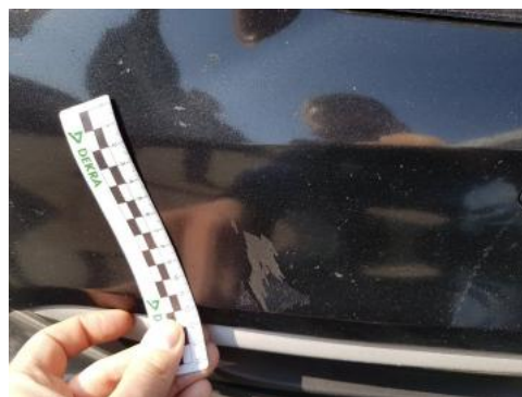
Fot. 26 Zderzak (Inne)