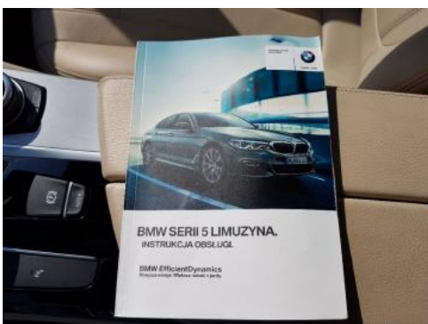
Fot. 23 Instrukcja obsługi