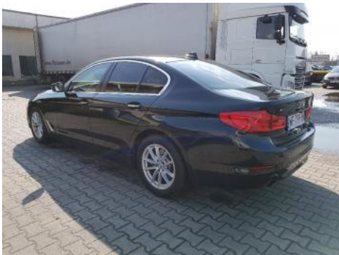
Fot. 5 Lewy bok tył