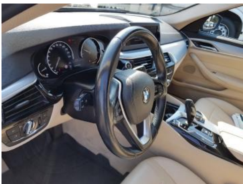
Fot. 15 Kierownica widok z lewej strony (widoczne przełączniki)