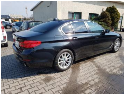
Fot. 3 Prawy bok tył