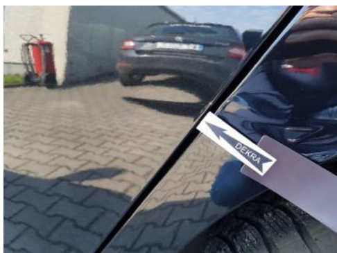
Fot. 41 Drzwi tylne lewe (Wgniec./Odształ.)