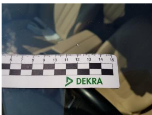
Fot. 31 Szyba czołowa (Rysa/Odprysk)