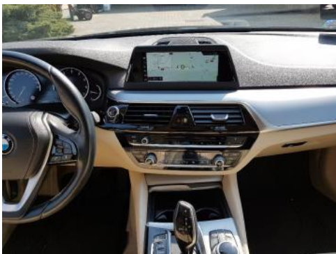
Fot. 13 Konsola środkowa