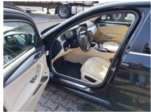
Fot. 10 Widok przez lewe przednie drzwi