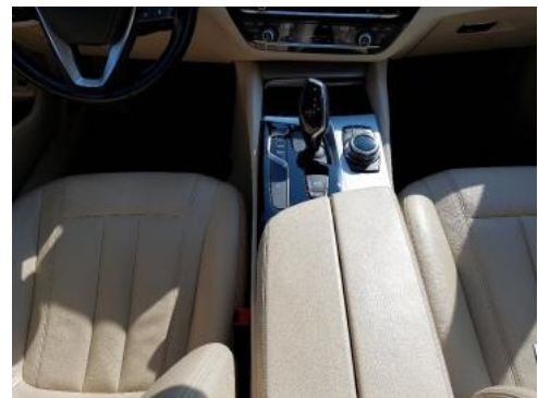
Fot. 14 Tunel środkowy