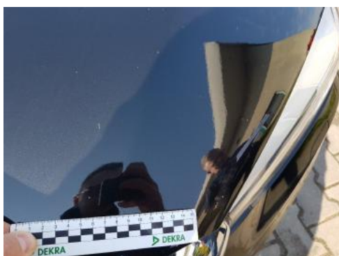
Fot. 29 Pokrywa komory silnika (Rysa/Odprysk 1)