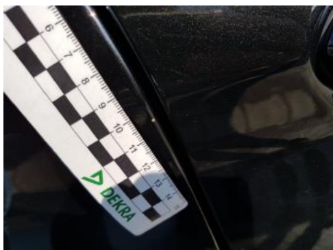
Fot. 33 Drzwi tylne prawe (Rysa/Odprysk)