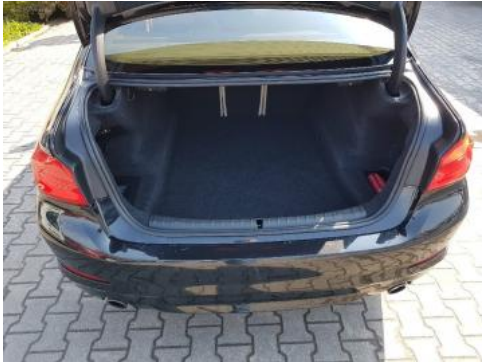
Fot. 17 Bagażnik