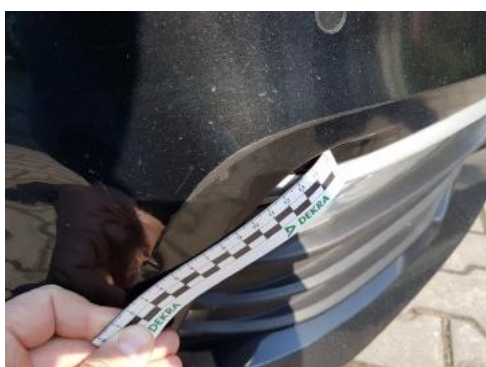
Fot. 27 Zderzak (Inne 1)