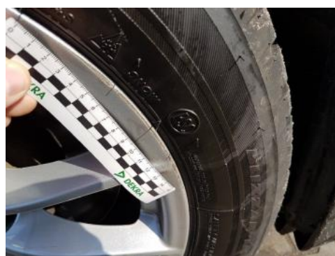
Fot. 32 Felga przednia prawa (Rysa/Odprysk)