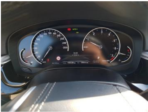
Fot. 9 Wskaźniki /przebieg/paliwo