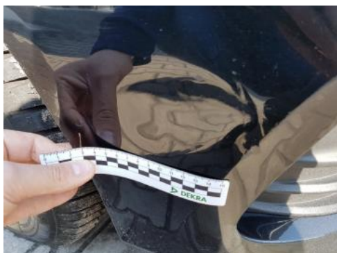
Fot. 25 Zderzak (Wgniecie./Odształa. 1)