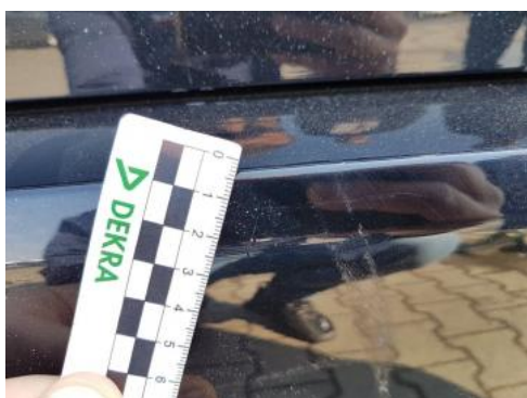
Fot. 37 Zderzak tylny (Rysa/Odprysk 1)