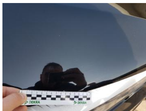
Fot. 30 Pokrywa komory silnika (Rysa/Odprysk 2)