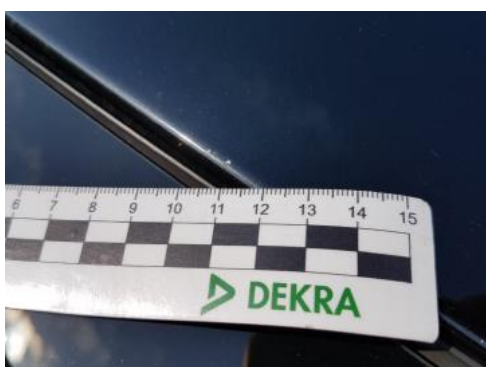
Fot. 39 Dach (Rysa/Odprysk 1)