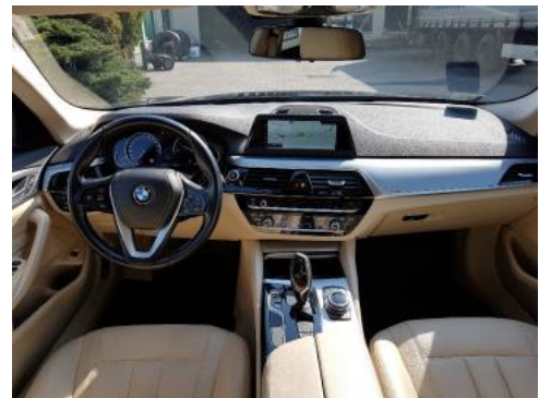
Fot. 12 Widok z tylnego siedzenia