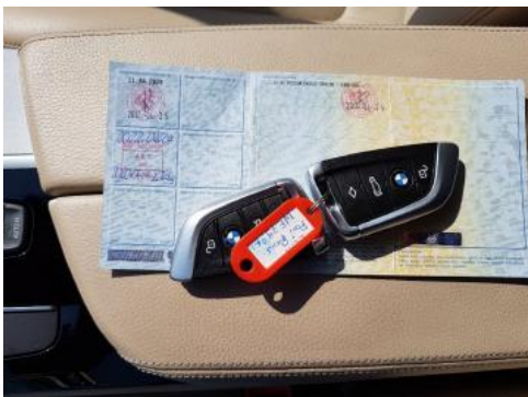
Fot. 21 Dowód rejestracyjny 2. strona / klucze