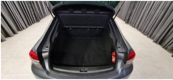
Fot. 17 Bagażnik