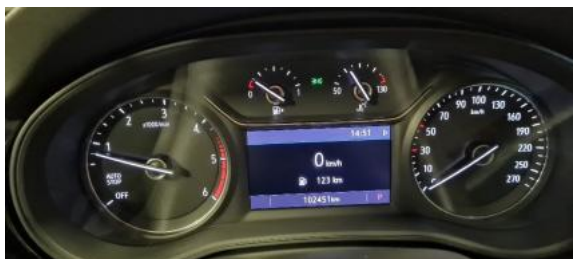
Fot. 9 Wskaźniki /przebieg/paliwo