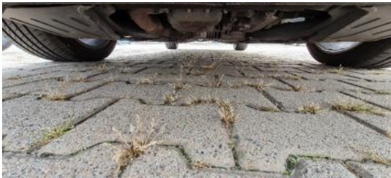
Fot. 19 Spód pojazdu przód