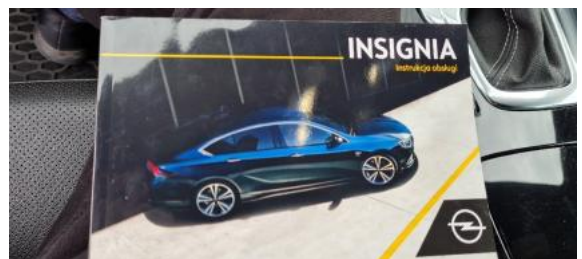
Fot. 24 Instrukcja obsługi