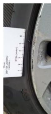
Fot. 28 Felga przednia prawa (Rysa/Odprysk 2)