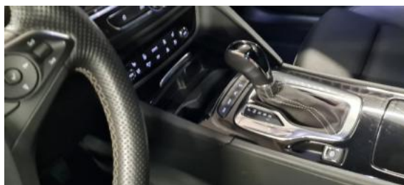
Fot. 14 Tunel środkowy