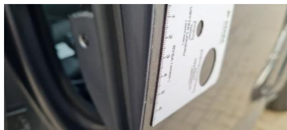
Fot. 30 Drzwi przednie prawe (Rysa/Odprysk)