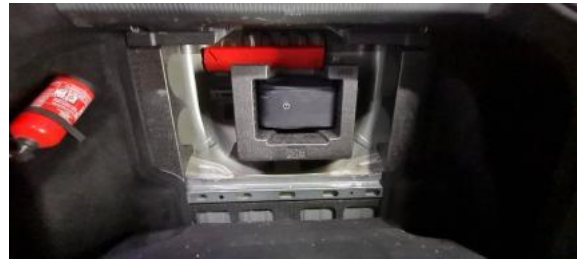
Fot. 18 Koło zapasowe/trójkąt/gaśnica