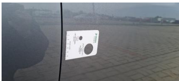
Fot. 29 Drzwi przednie prawe (Zdjęcie poglądowe 1)