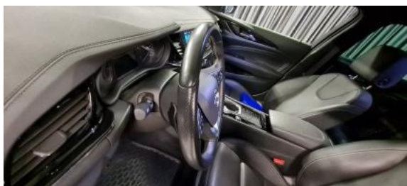
Fot. 15 Kierownica widok z lewej strony (widoczne przełączniki)