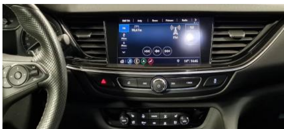
Fot. 13 Konsola środkowa