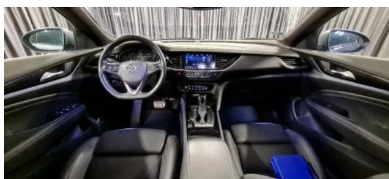
Fot. 12 Widok z tylnego siedzenia