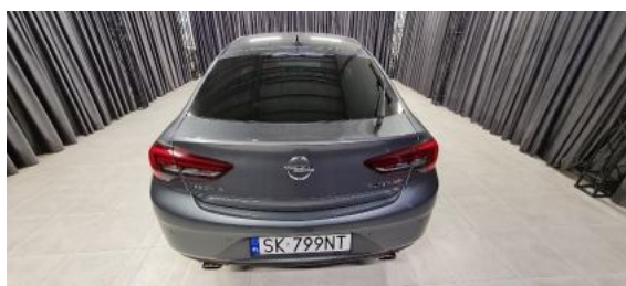
Fot. 4 Tył