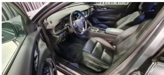
Fot. 10 Widok przez lewe przednie drzwi