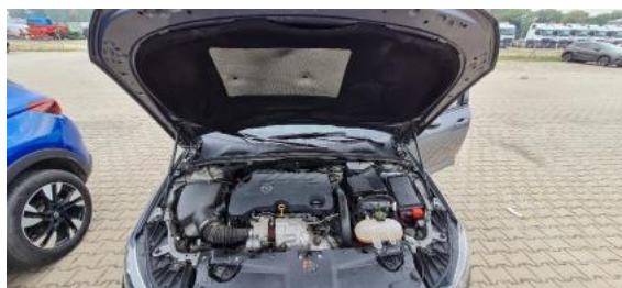
Fot. 16 Komora silnika