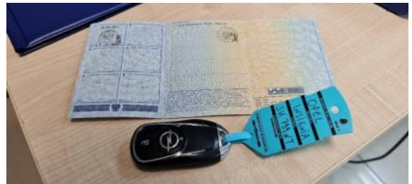
Fot. 22 Dowód rejestracyjny 2. strona / klucze