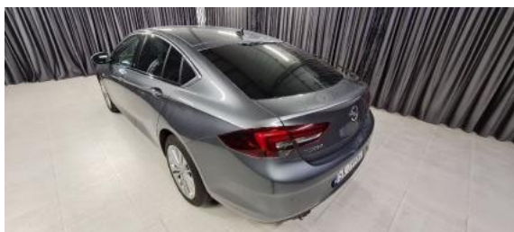
Fot. 5 Lewy bok tył