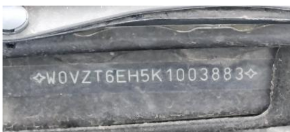
Fot. 7 Pole numerowe