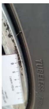
Fot. 27 Felga przednia prawa (Rysa/Odprysk 1)