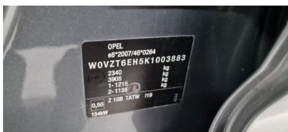
Fot. 8 Tabliczka