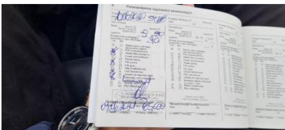
Fot. 23 Książka serwisowa - ostatni przegląd