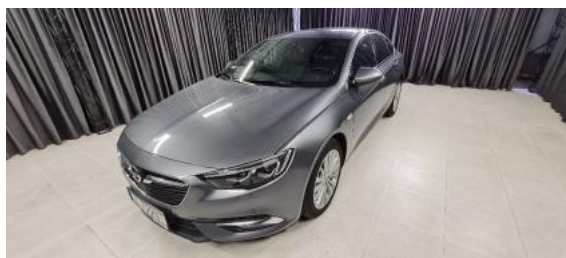
Fot. 6 Lewy bok przód