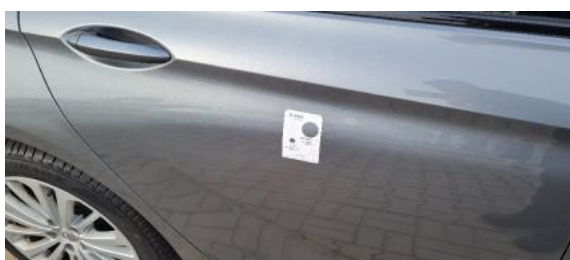
Fot. 31 Drzwi tylne prawe (Zdjęcie poglądowe 1)