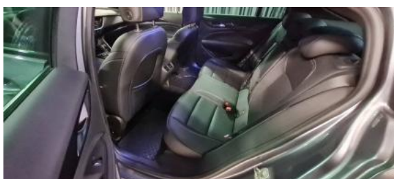
Fot. 11 Widok przez lewe tylne drzwi