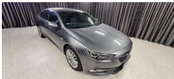
Fot. 2 Prawy bok przód