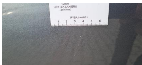
Fot. 32 Drzwi tylne prawe (Rysa/Odprysk)