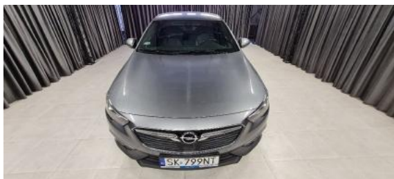
Fot. 1 Przód