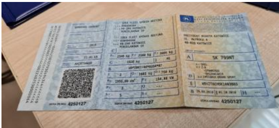
Fot. 21 Dowód rejestracyjny 1. strona