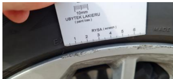
Fot. 26 Felga przednia prawa (Rysa/Odprysk)