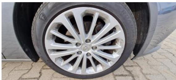
Fot. 25 Felga przednia prawa (Zdjęcie poglądowe 1)