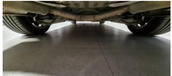
Fot. 20 Spód pojazdu tył