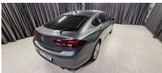
Fot. 3 Prawy bok tył